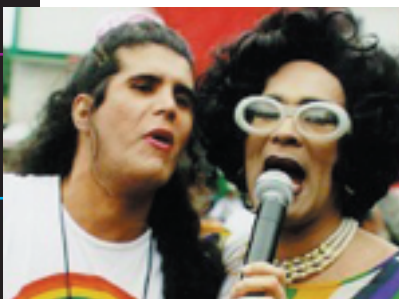
Marcha do Orgulho Gay Madureira - 2001