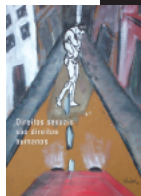
Reprodução de postais ABIA - campanha Direitos Sexuais são Direitos Humanos