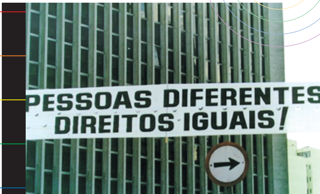
Passeata do Orgulho Gay São Paulo - 2001

O que se sabe, de fato, é que, não obstante todo o avanço, o campo sexual brasileiro (e global) ainda está minado e em disputa: o "sangue gay ainda é ruim"; as bichas continuam a morrer vítimas da homofobia; as "travas-mirins" continuam sendo ridicularizadas nas escolas do todo o Brasil; o homossexual ainda é concebido como "tendo o demônio no couro" – pelo menos é o que dizem os evangélicos caminhando na contramão da ciência, que não só tirou da ordem das patologias as formas alternativas de sexualidade, mas jogou da biologia para o campo dos Direitos Humanos, enquanto construções sociais, as problemáticas da homossexualidade: estigmatização e discriminação!