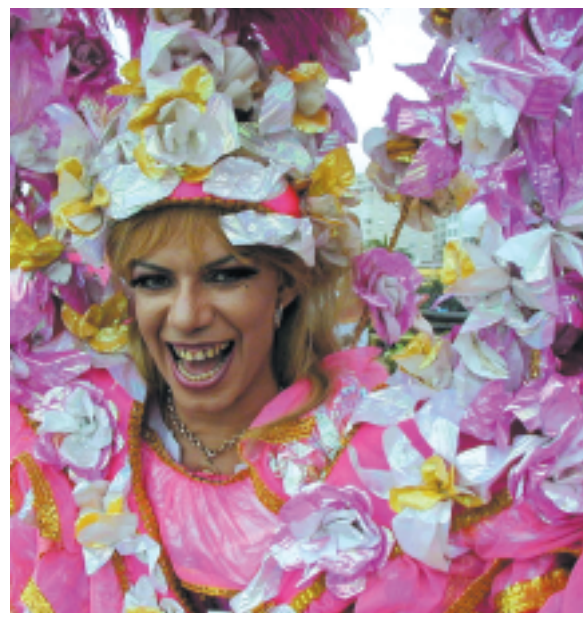
Suzart - Passeata do Dia Internacional da Luta Contra a AIDS